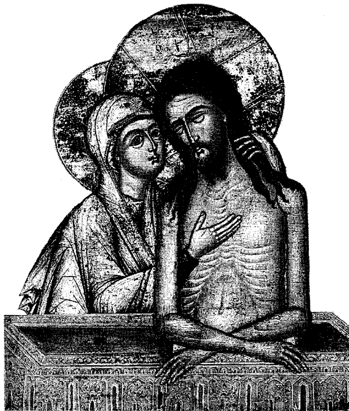
«Icona dello Sposo» (Russia, XIX secolo)