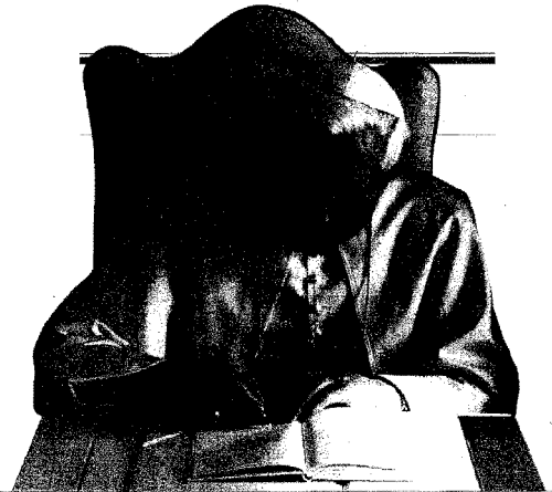
DISEGNO DI DOMENICO ROSA