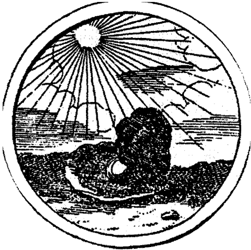
«Clarescit aetere claro» (dal libro di Florenskij «La colonna e il fondamento della verità»)